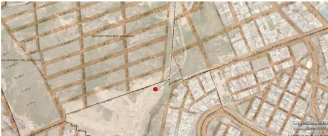
Imagen No. 1. Ubicación geográfica de la intervención de la quebrada La Carbonera.